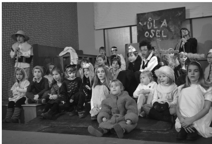
Vánoční pohádka dětí – Vůl a osel